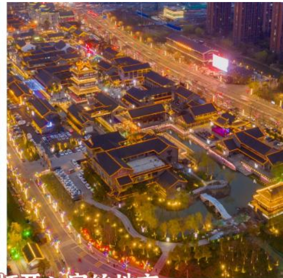
盐城，一个让人打开心扉的地方